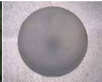
アルミダイキャスト 表